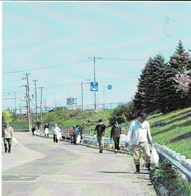
◀ ゴミ拾いをする参加者の皆さん

春の一斉清掃ごみ拾い、第一ワラビ川側溝清掃に44人がご参加いただきました。環境美化にご協力ありがとうございました。(5/14)=対馬環境部長