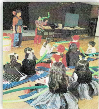
初めてのバルーン体験