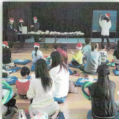
6年生の進行でビンゴ大会！