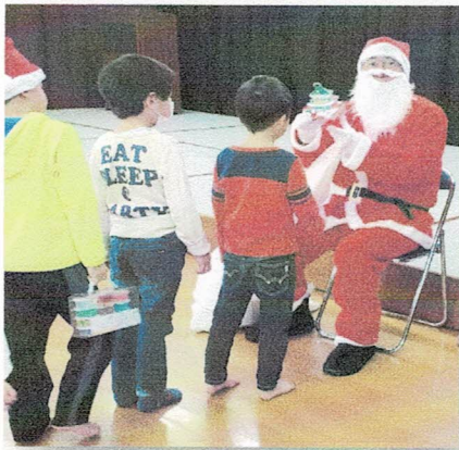
サンタからのプレゼン 何か！？

クリスマス会は、30名の児童が参加され、サンタさんのプレゼントに大喜びでした。12/10