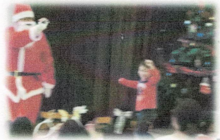
サンタの登場に大喜び！